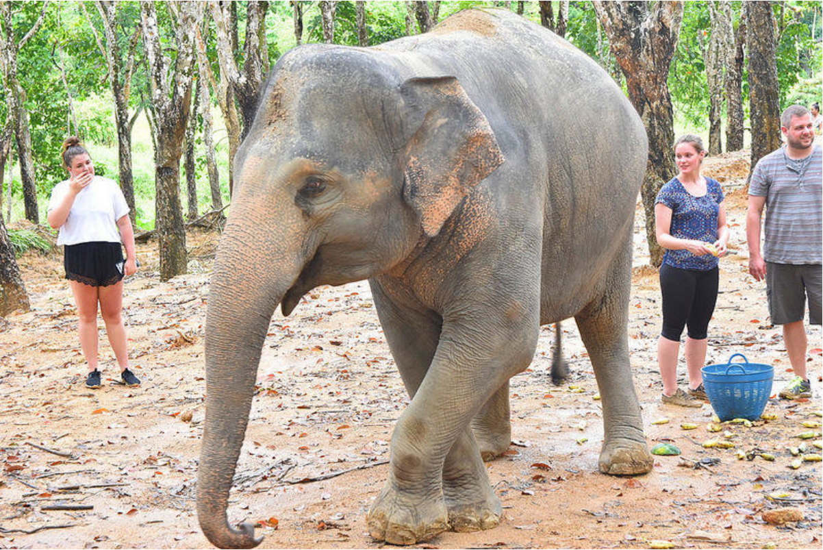
小象宝宝超可爱的~~~~~(眼睛爱心)