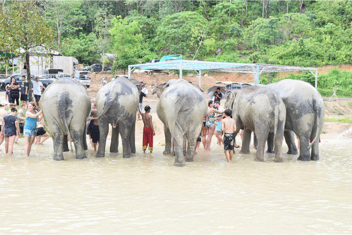
最後把大象帶到他們的淋浴間 就大功告成嘍~