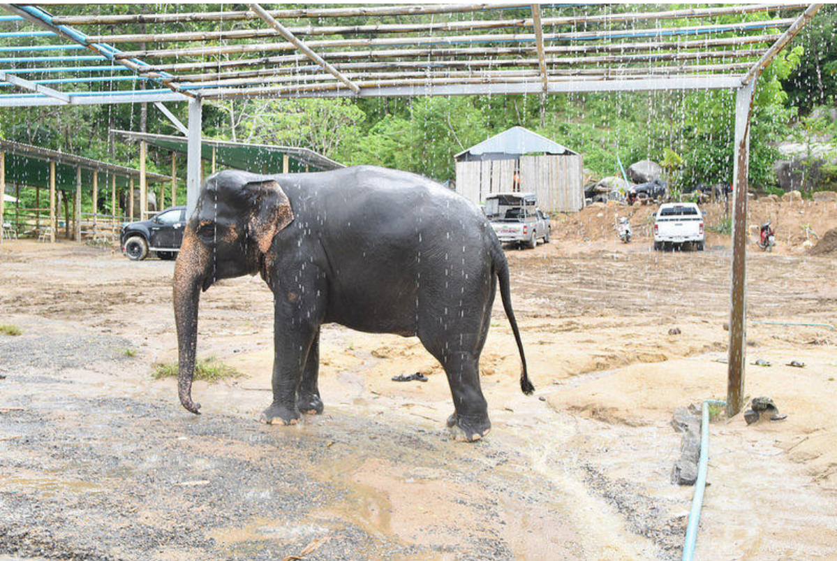
大家也順便沖洗干淨