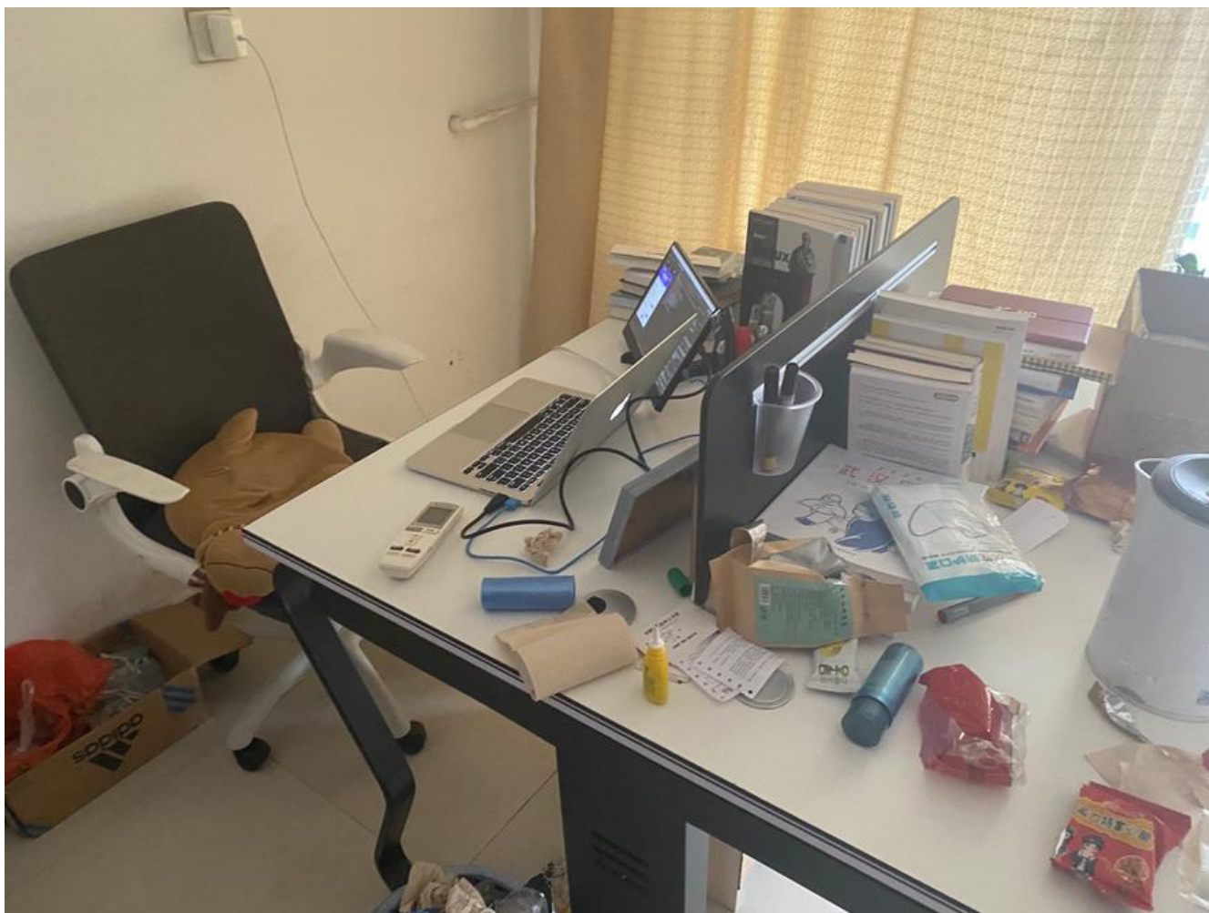
我写这篇文字的情景