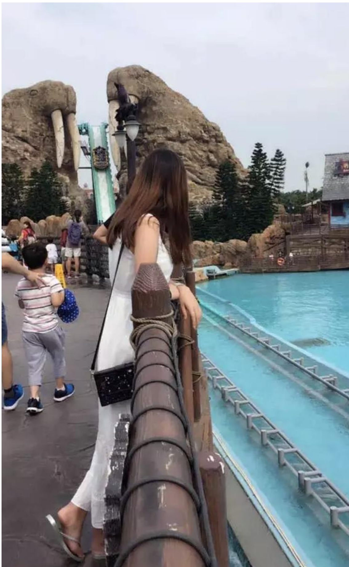
(珠海长隆，请忽略拖鞋)