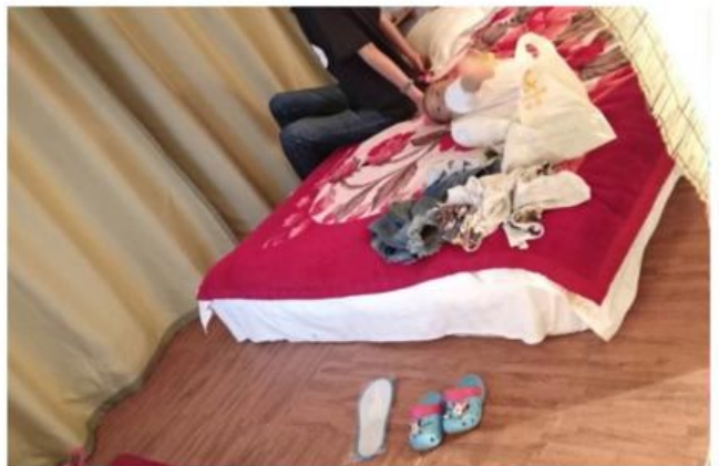
Day 5 格姆女神山-小落水村-泸源崖-情人滩-草海