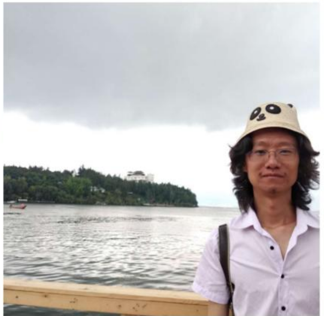
Day 8 下关