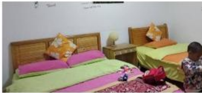
Day 7 丽江古城-双廊-下关