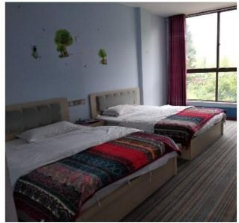
Day 6 博物馆-走婚桥-宁蒍-丽江