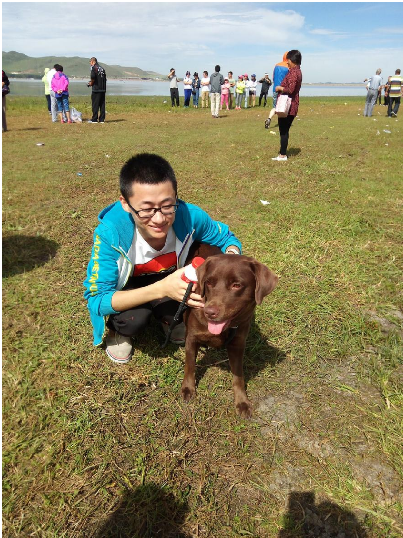
【遛狗】神奇大疆啊，彻底解放双腿