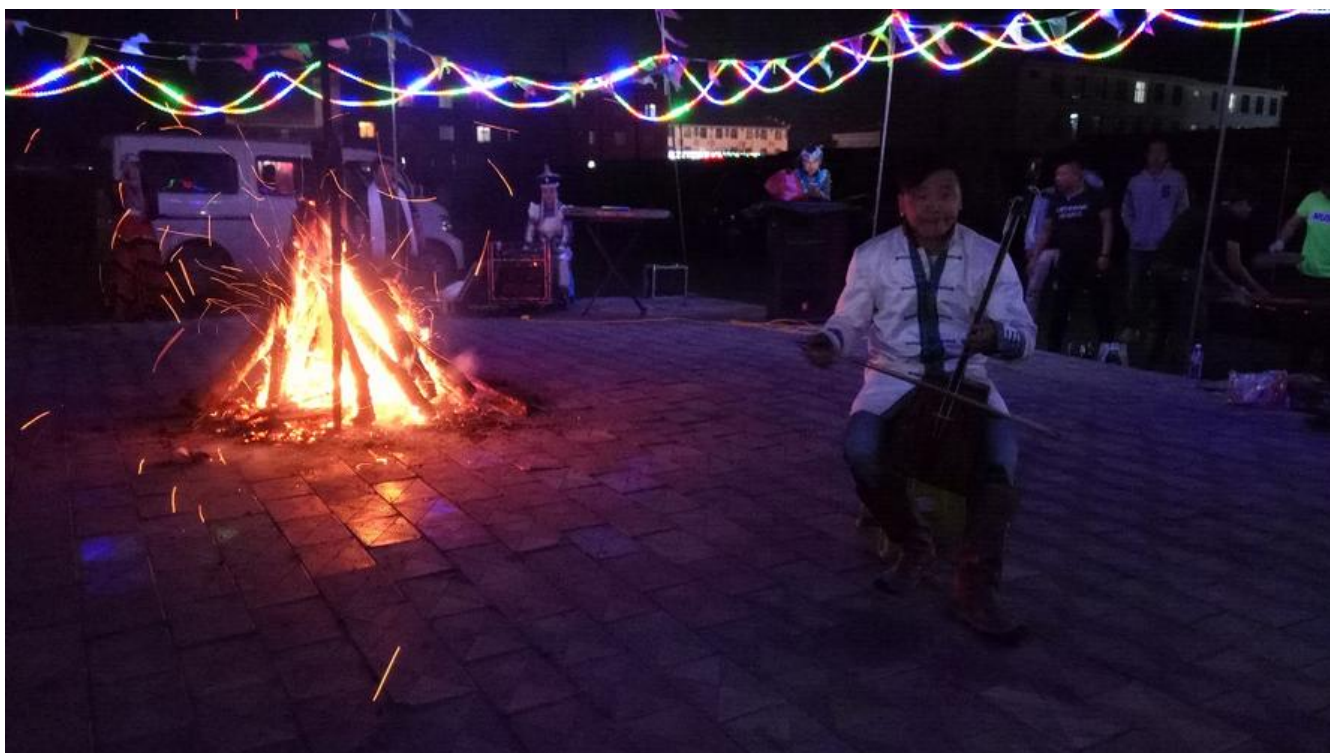
【日出】丰宁坝上并不适合看日出，太阳出来已经没法看了