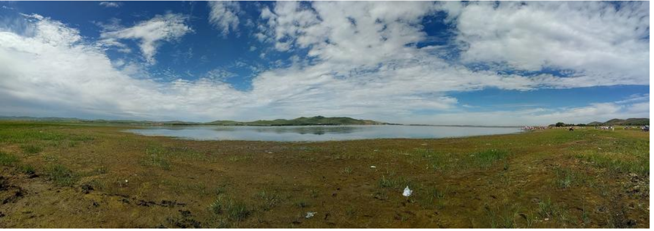
【第一次上镜】我和汪星人